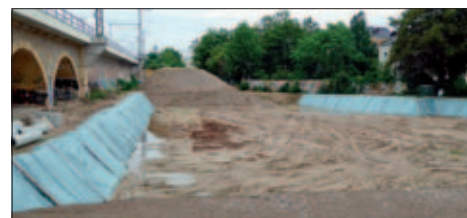
Blick in die Baugrube am 8. Juli 2021