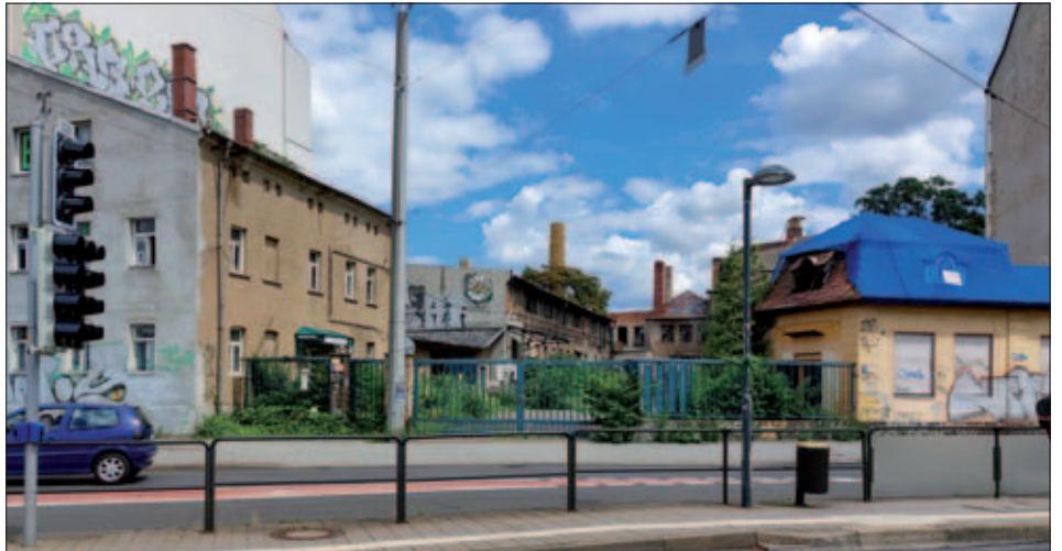
Blick auf den Zugang des zu entwickelnden Geländes, im Hintergrund die alte Industriehalle, Foto vom 12. Juli 2021

Gemeinsam mit der Stadt Leipzig und der Nachbarschaft sollen im Herbst zum Tag des offenen Denkmals die Ergebnisse des Werkstattverfahrens öffentlich präsentiert werden. Dafür ist eine Ausstellung vom 9. bis 12. September 2021 in der Industriehalle mit Pressekonferenz zur Eröffnung am 9. September 2021 geplant. J. Weibrauch (Quelle: „Leipziger Zeitung“ v. 29. Juni 2021)